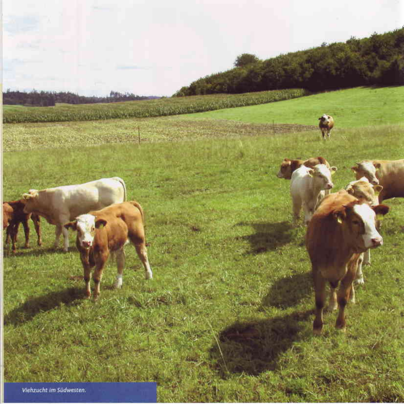
Viehzucht im Südwesten.