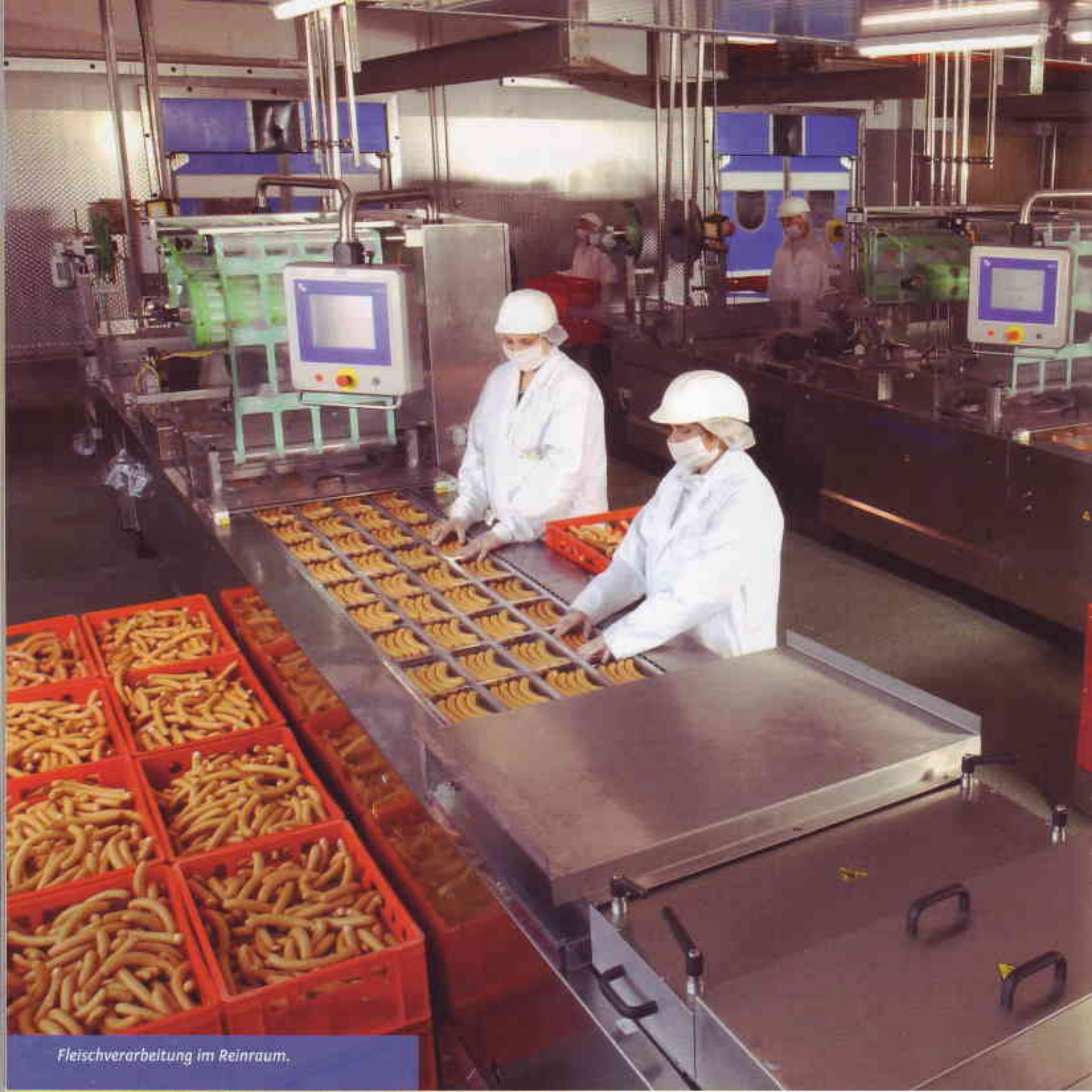
Fleischverarbeitung im Reinraum.