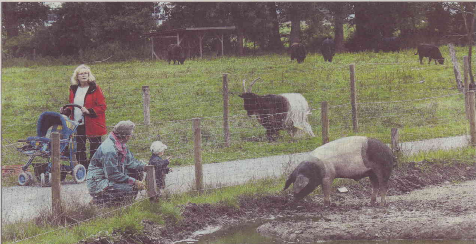
LANDSCHAFTSPARK Hagsfeld: Ihn wollen SPD und CDU erhalten. Die Stadtverwaltung soll deshalb das bereits beschlossene Gewerbegebiet wieder rückgängig machen.